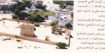
وثائق الخليج - شمال ١٤٣٣هـ - يناير ٢٠٠٢م