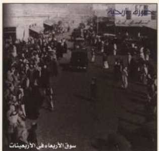
سوق الأربعاء في الأربعينات