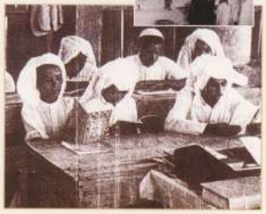
المرشد الشيخ - ربيع الأول ١٤٢٨هـ / أبريل ٢٠٠٧م