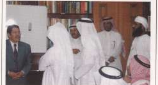
لجج القسم في تنظيم اجتماع الأمانة العامة الثالث والعشرين والذي تمخض عن عدد من الوثائق والقرارات بصيغة الأمانة